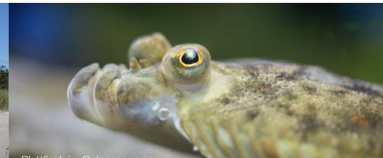
Plattfisch im Ostseeaquarium