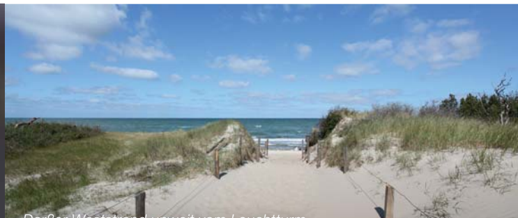
Darßer Weststrand unweit vom Leuchtturm