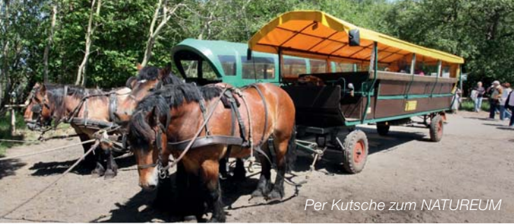
Per Kutsche zum NATUREUM