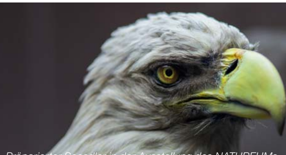
Präparierter Seeadler in der Ausstellung des NATUREUMs