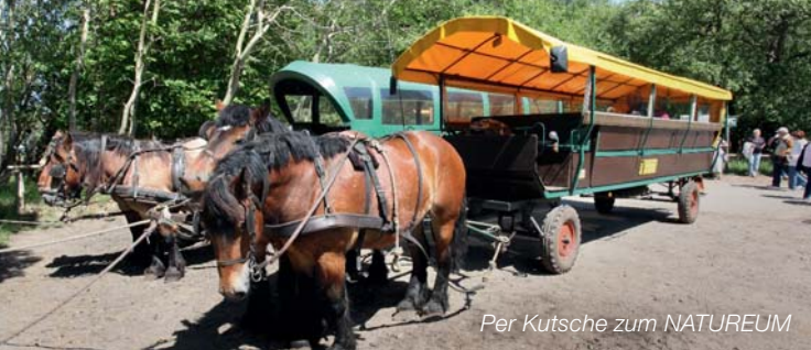
Per Kutsche zum NATUREUM